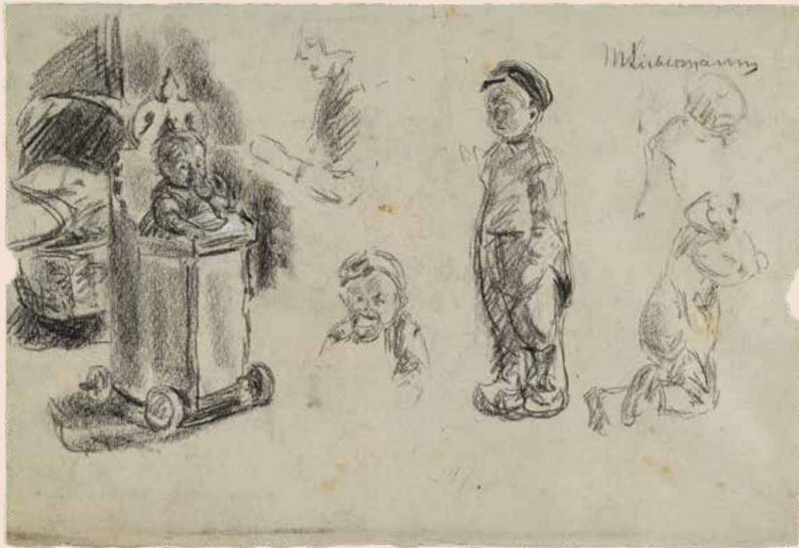
LINKS Max Liebermann, Kinderstudien (Study drawings of children), um 1890, schwarze Kreide, mit weißer Kreide gehöht auf graugrün gefärbtem Papier (vélin) KUPFERSTICHKABINETT SMB, IDENT.-NR. SZ LIEBERMANN 100