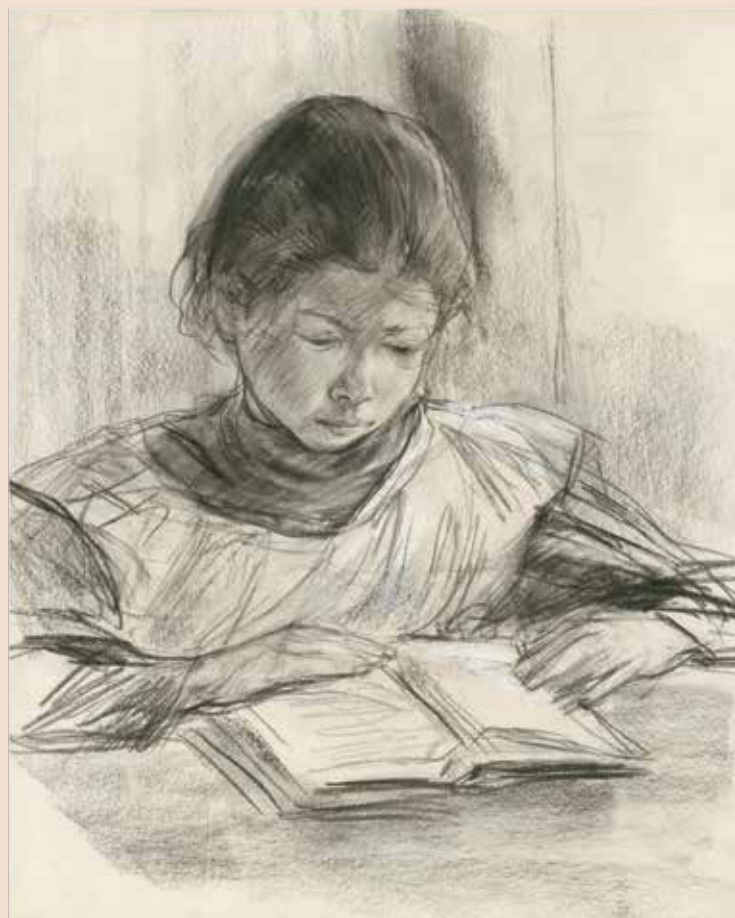
OBEN Max Liebermann, Käthe, die Tochter des Künstlers, lesend (Käthe, the artist's daughter, reading), 1896, schwarze Kreide, mit weißer Kreide gehöht KUPFERSTICKKABINETT SMB, IDENT.-NR. SZ LIEBERMANN 7